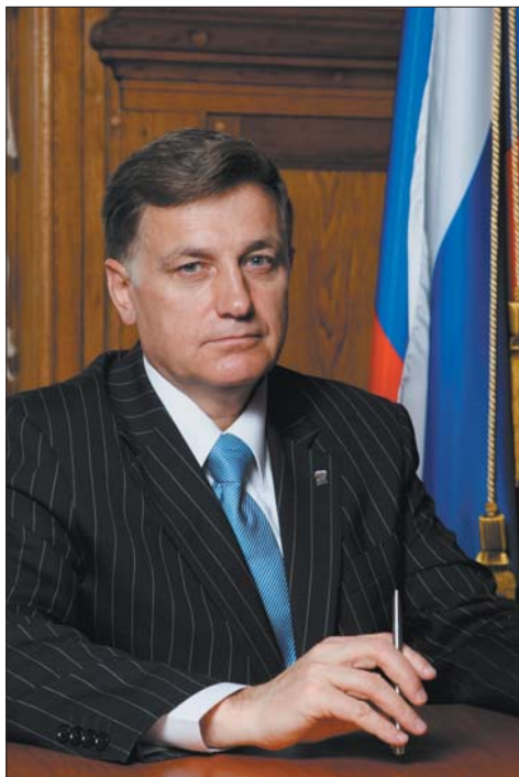
Вячеслав МАКАРОВ Председатель Законодательного Собрания Санкт-Петербурга, Секретарь Санкт-Петербургского отделения партии «ЕДИНАЯ РОССИЯ»

Доброго вам здоровья, чуткости и сердечного тепла ваших родных и близких! Мира и благополучия всем петербуржцам-ленинградцам!