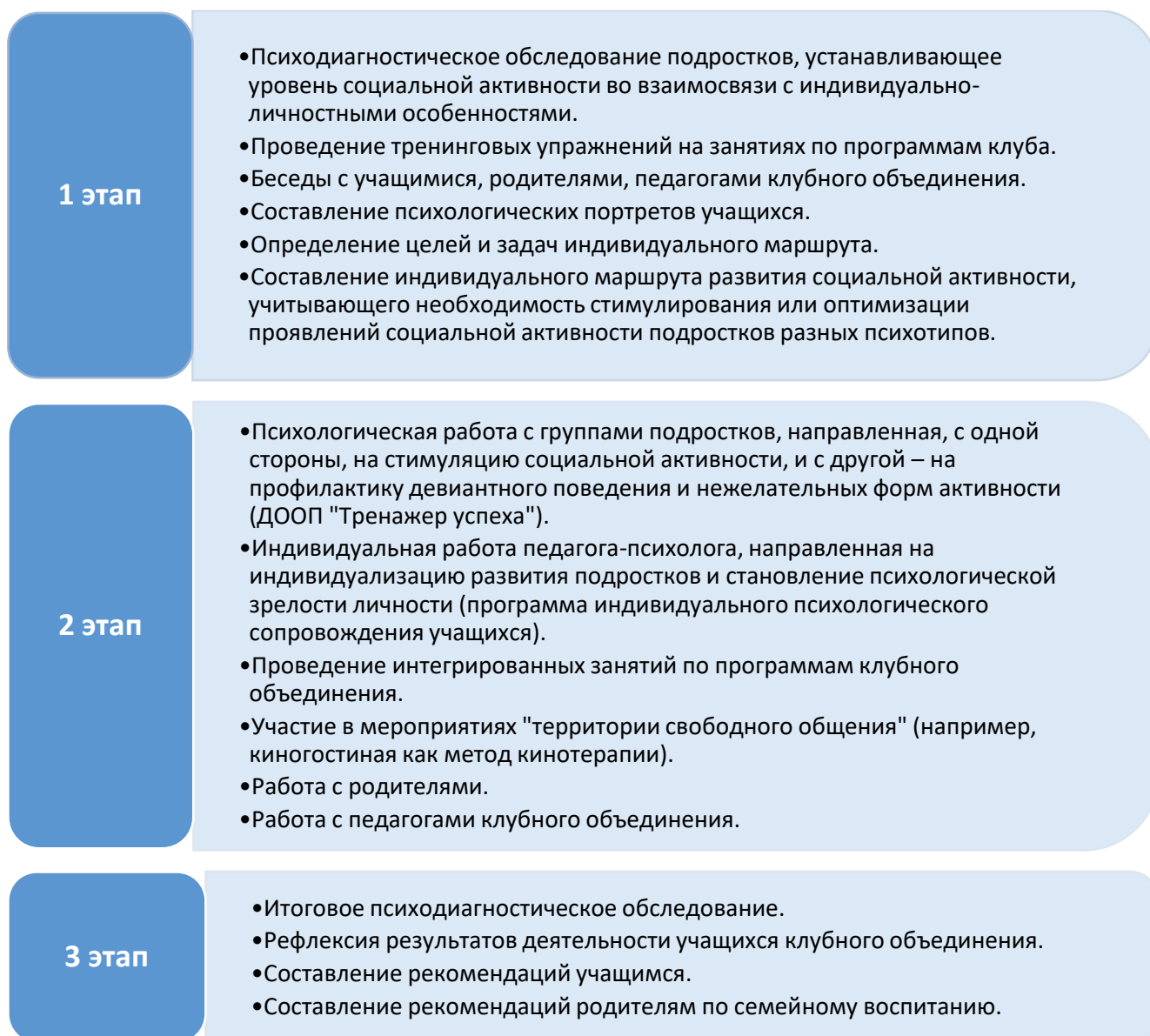
Схема 1. Этапы психолого-педагогического сопровождения индивидуального образовательного маршрута развития социальной активности детей и подростков

Наглядно содержание этапов психолого-педагогического сопровождения индивидуального образовательного маршрута развития социальной активности детей и подростков представлено на схеме 1.