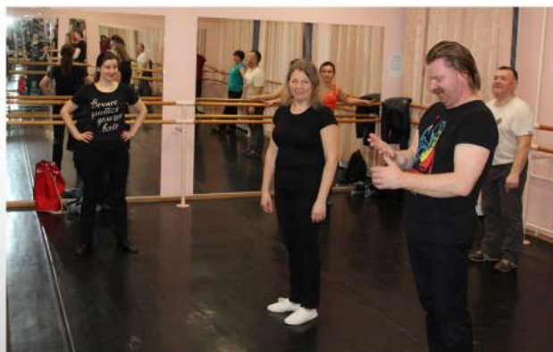
Репетиция к выпуску 2017