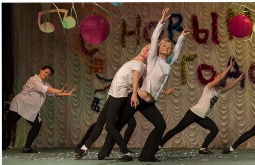
Новогоднее выступление 2017