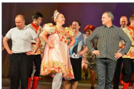
Выпускной концерт 2016