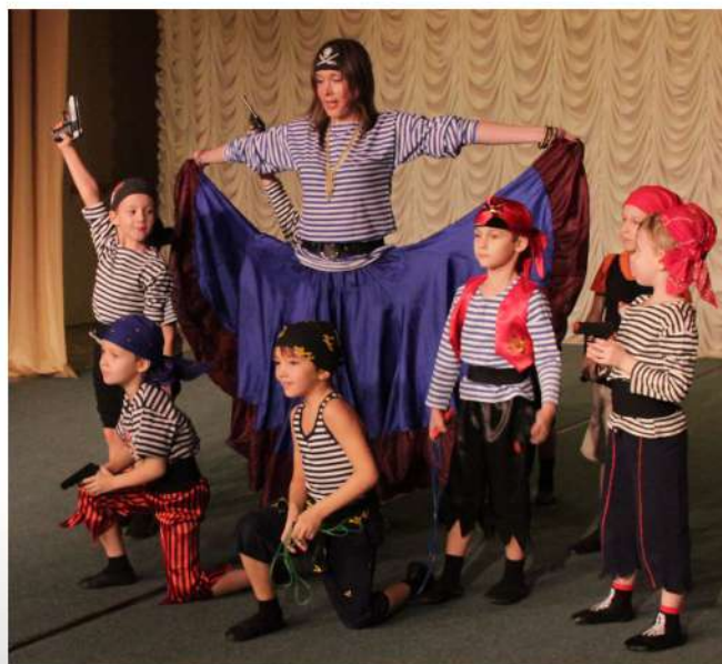
Совместный концерт родителей и детей “День рождения рядом с мамой” 2017 г