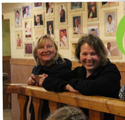
Совместная поездка в Ярославль 2018