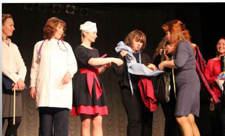
Весенний праздник 2018