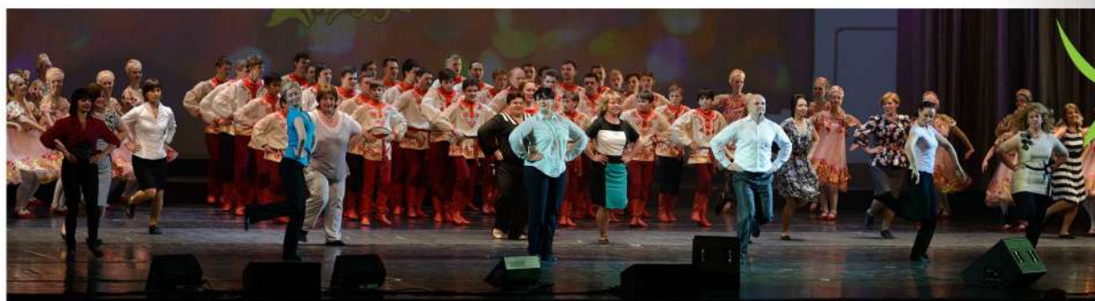
Юбилейный концерт ансамбля 2015