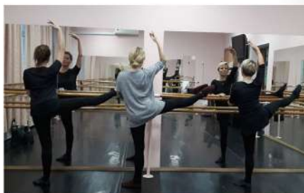
Репетиция к отчетному концерту 2016