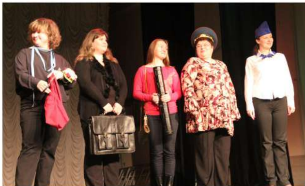
Весенний праздник 2018