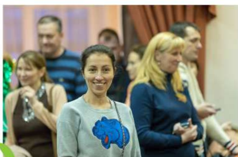
Концерт “Мамин вальс”, 2018