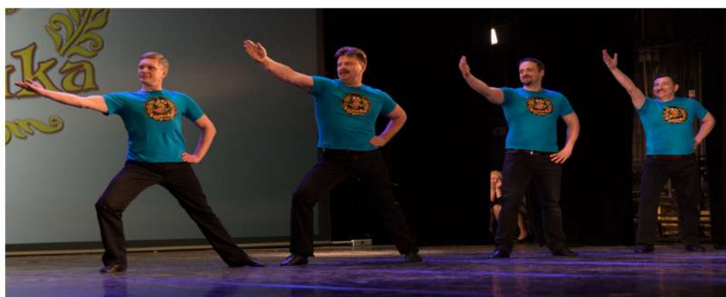
Выпускной концерт 2017