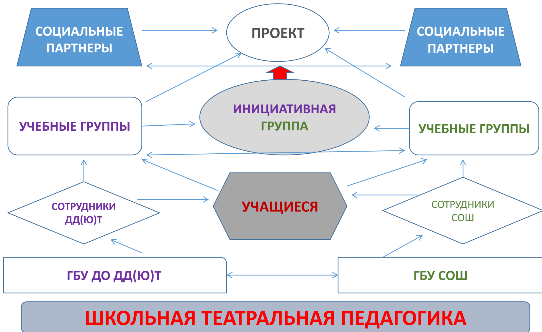
СХЕМА образовательной практики «МОСТик «Шкода»