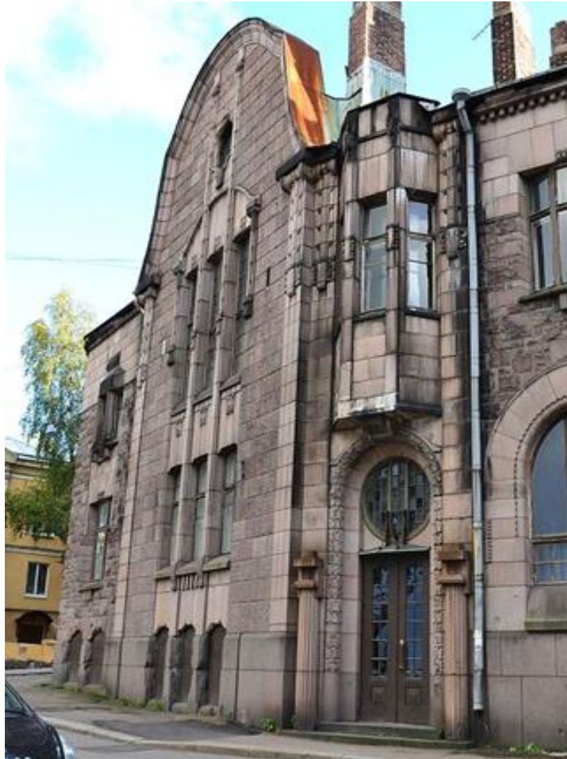
Гранитный дворец. Дом Лаллука