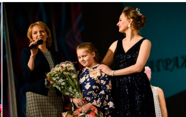
Концерты в поддержку детей – подопечных фонда «AdVita»