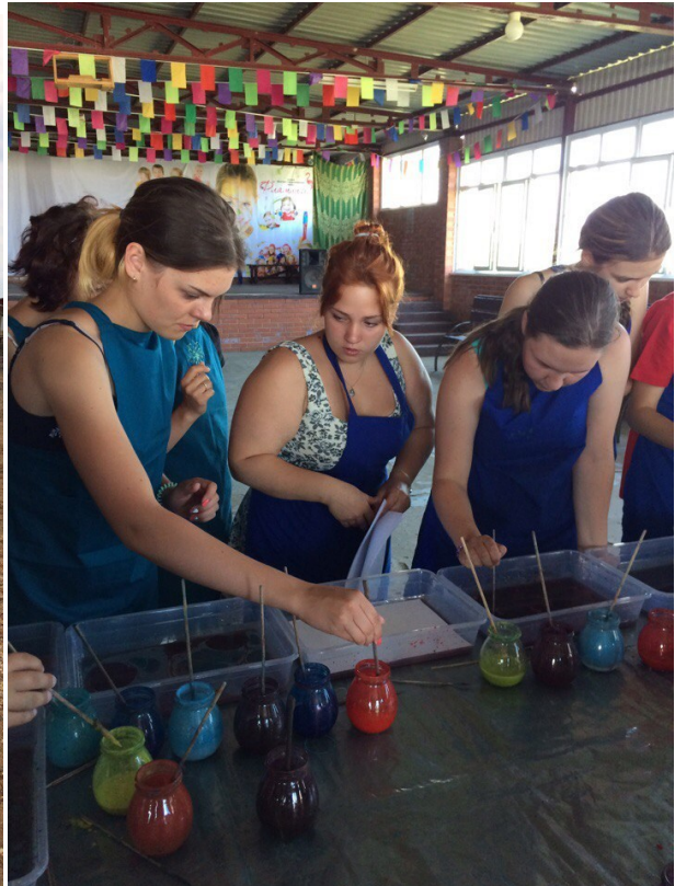
Выезд в ДОЛ «Фламинго»