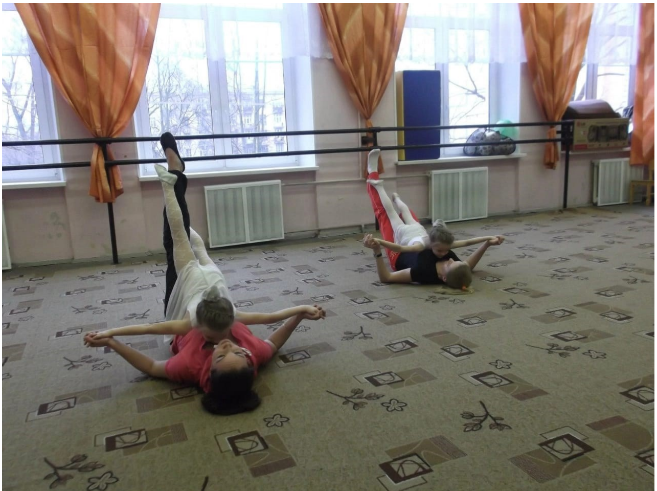
Мастер-класс «Семейный фитнес»