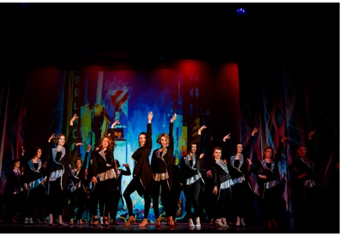
Отчетный концерт студии танца «ГарДарикА». Танцуют родители